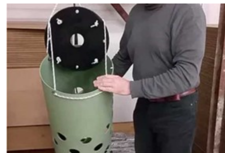
Makkelijk te vullen