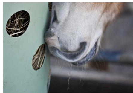
Veilige openingen, glatte afwerking